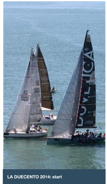
LA DUECENTO 2014: start

First, Second and Third for each class if the class counts more than 5 boat.