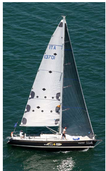
Black Angel IRC 500X2 Overall winner 2014

Classes not mentioned above: will be awarded to the first in corrected time or in real time for O.D. classes.