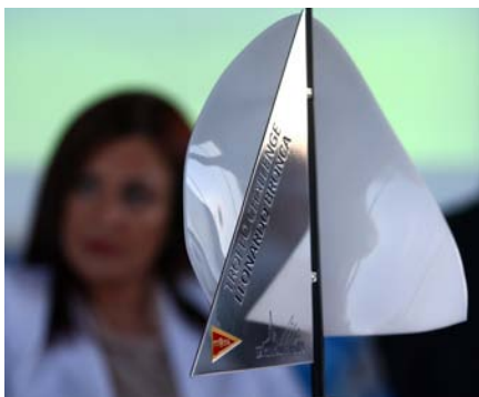
Trofeo Challenge Leonardo Bronca istituito nel 2014.

Il Comitato Organizzatore potrà istituire premi aggiuntivi oltre a quelli previsti.