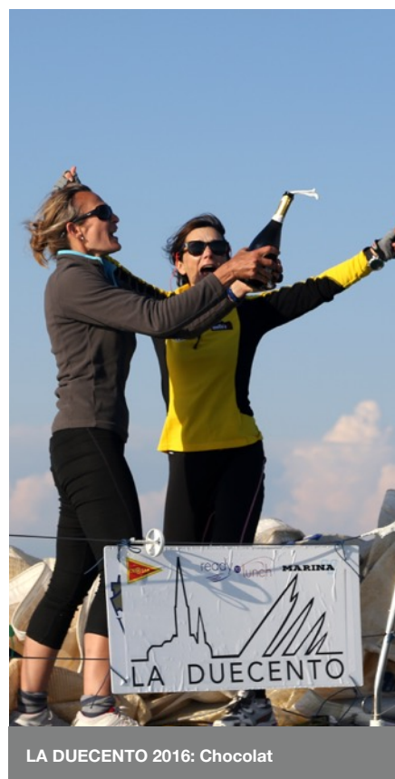
LA DUECENTO 2016: Chocolat

Underwater breathing apparatus and plastic pools or their equivalent shall not be used around keelboats between the preparatory signal of the first race and the end of the regatta. “DP”