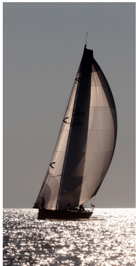
WILLIAM B di Bottecchia/Trevisan 200XTutti ORC-IRC Overall winner 2016

I concorrenti prendono parte alla regata a loro rischio e pericolo, secondo quanto stabilito dalla RRS 4 "Decisione di partecipare alla regata". Il Comitato Organizzatore non assume alcuna responsabilità per danni alle cose, infortuni alle persone o nei casi di morte che avvengano a causa della regata prima, durante o dopo la stessa.